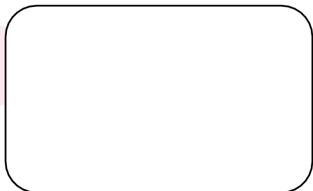
Carimbo da Escola